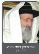
הרב הרב מרדכי זקוק שליט"א ראש מוסדות