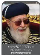
הרב עובדיה זקוק שליט"א הרב הראשי לירושלים בעבר שיא מוסדות הדינים