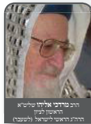
הרב מרדכי אליהו שליט"א ראש הדין הרבני הראשי לישראל (לשעבר)