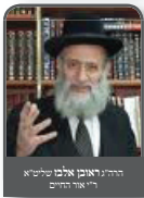
הרב הרב אברהם אברהם שליט"א ראש אור הדינים