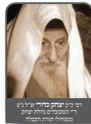
הרב מרדכי כהנא שליט"א ראש המוסדות לתורת עומק במסגרת חרות המעלה