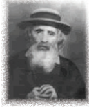
נאם יצחק ירוחם בהאגון החסיד מוה"ר משה יהושע יהודא לייב זצ"ל דיסקין

קודם הלימוד יאמר: הרי אנחנו נלמדים בספר הזהר הקדוש לעילוי שכיתת עוונות ולהרים קרן מזל ישראל ולסתום פי כל הצרים אותנו עליונות ותחתונות ולהחזיר העטרה ליושנה ויאמר די לצרותינו וישראל ישכון לבטח אמן כ"ה.