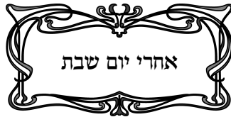
מקור המאמר בזהר פרשת אחרי דף פח ע"ב

בְּיוֹם הַשַּׁבָּת, בְּסַעֲוֹדָה הַשְּׂנִיָּה כָּתוּב אֲזַ תִּתְעַנֵּג עַל ה'. עַל ה' וְדָאֵי. שְׁאוּתָהּ שְׁעָה נִגְלָה הָעֲתִיק הַקָּדוֹשׁ, וְכָל הָעוֹלָמוֹת בְּשִׂמְחָה, וְהַשְּׁלֵמוֹת וְהַחֲדוּהָ שֶׁל הָעֲתִיק אָנוּ עוֹשִׂים, וְזוּהִי סַעֲוֹדָתוֹ וְדָאֵי.