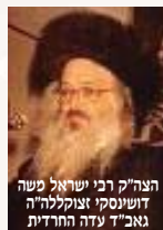
הצה"ק רבי ישראל משה דושנסקי זצוקללה"ה גאב"ד עדה החרדית

והנה בעת כזאת שעת צרה היא ליעקב בגשמיות וברוחניות ברחבי ארץ הקודש תבנה ותכונן ובתפוצות ישראל בארצות סזורנו, עינינו נשואות לאבינו שבשמים שיתעוררו רחמי על שארית פליטתינו, ושומר ישראל ישמור שארית ישראל וכו', ושנזכה לראות בקרוב בתגלות כבוד שמו יתברך על עמו ארצו ונחלתו ובכל העולם ובישועת השם כביאת משיח צדקינו וברמים גדולים יקבצנו מארבע כנפות הארץ לארצינו.