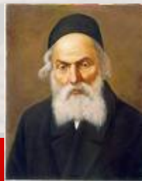
החפץ חיים וזוהר ראו דף מס' 8