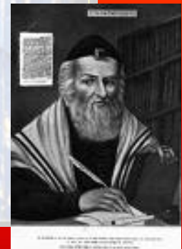
הגר"א וזוהר ראו דף מס' 5