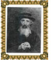
רבי יהושע לייב דיסקין

כבר ידוע לכבודם מעלת למוד הזוהר הקדוש אשר הוא מבטל כל מיני פורעניות וגזירות קשות ורעות ומותנא וחרבה ובזה מעלמא, והשנה שעברה כבר עוררנו עם ישראל "תקון לגאולה האמיתית" מטעם רבנים הגאונים מארי דארעא קדישא" הנז"ל לשקוד על לימוד הזוהר לגמור בארץ ובחוצה