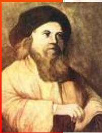
הבעש"ט וזוהר ראו דף מס' 6