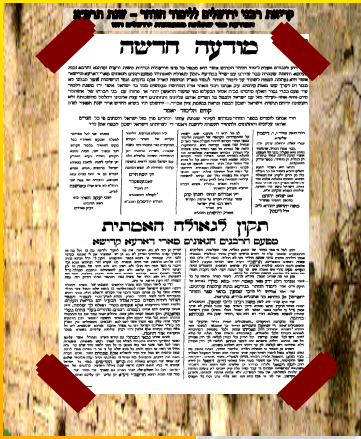
ראו דף מס' 2