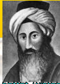
החיד"א וזוהר ראו דף מס' 4