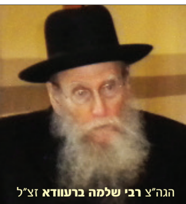
הגה"צ רבי שלמה ברעוודא זצ"ל