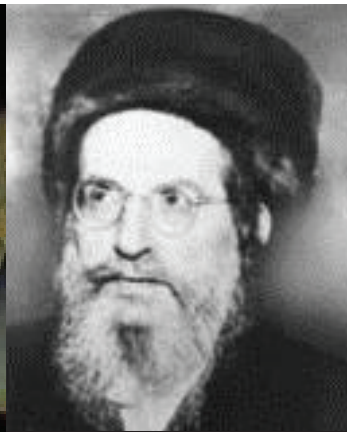
רבינו בעל הסולם נשמת האריז"ל בדורינו