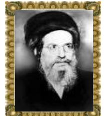
הגה"צ רבי יהודה לייב אשלג זצ"ל בעל מחבר ספר "הסולם" על הזוהר